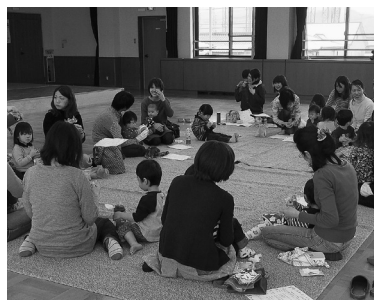
地区で開いている子育て講座にボランティアとして参加▼