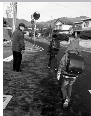
▲毎週月曜日に子どもたちの見送りをしています