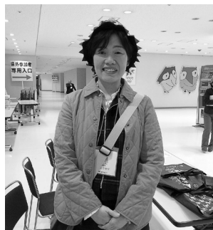
▲日野原重明さんの講演会「平和と命こそ」で受付を担当しました