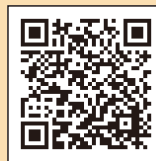
▲監査一覧はこちらから

令和7年度定期監査(中期・後期)報告書、令和7年度随時監査(工事監査・後期)報告書、令和7年度財政援助団体等監査報告書【株式会社エムウェブ】、令和7年度財政援助団体監査報告書【長野市戸隠交流集会施設(森林囃子、ふるさとセンター)】を市長に提出するとともに、部局長や財政援助団体等に監査結果の講評を行いました。中身については長野市公式ホームページに掲載されている定期監査、工事監査(随時監査)、財政援助団体等監査をご覧ください。