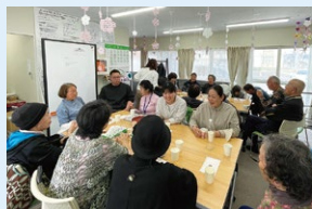
取り残され感の払拭が課題