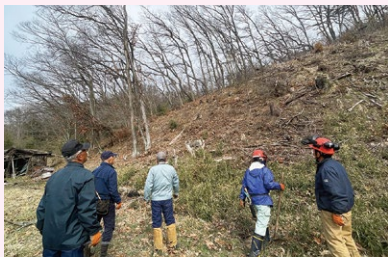
森林整備活動に参加

浅川地区の荒れた里山整備をする目的で「あさかわの里山と森を守る会」を結成し、毎年春と秋に森林整備活動をしています。私も久しぶりに参加しました。切り倒した木を玉に切り、切り出し薪割機で薪を作って販売しています。