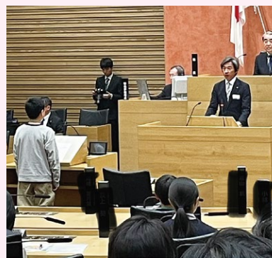
すばらしい提案が発表されました

毎年恒例のこども議会が開催されました。12の提案を17人の皆さんで発表してくださいました。毎年拝見していますがどんどんグレードアップしているように感じています。これからも素敵な提案をお願いします。