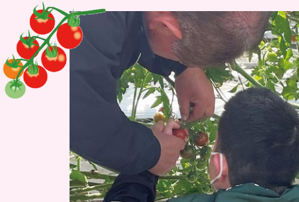
ていねいに指導されていました

総面積が2町歩以上といういくつかのビニールハウスで野菜の栽培をしています。障害のある方々が収穫等をされていますが、その方その方の出来ることをいかした仕事をいきいきとされていました。